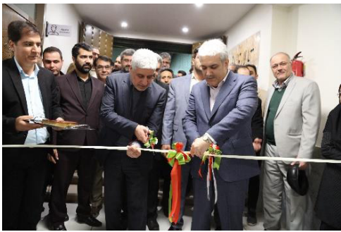
افتتاح مرکز رشد و کارآفرینی (فاز ۰ ناحیهی نوآوری) با حضور معاون علمی ریاست جمهوری. بهمن ۱۳۹۸

ناحیهی نوآوری دانشگاه اصفهان در ۳۲ هکتار از قسمت شمالی عرصهی دانشگاه (از درب شمالی تا سهراب زبان) قرار دارد. اقدامات اجرایی، در قالب ۵ فاز به شرح زیر انجام می‌گیرد: